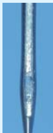
Ruperea firului superior